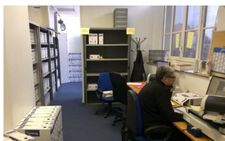
Numérisation des documents