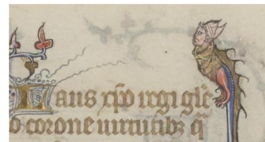
Grotesque du feuillet 454

Grâce à une maîtrise de l'utilisation judicieuse des sources lumineuses, la prise de vue sur banc photo a permis de faire ressortir les ors très présents sur les feuillets, tout en restant le plus fidèle possible au manuscrit original.