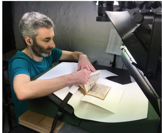
Numérisation du bréviaire sur banc photo