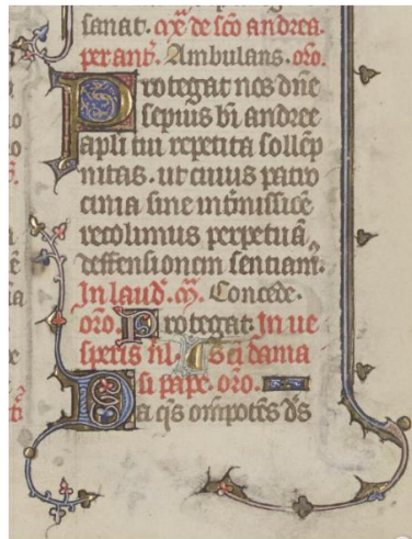
Feuillet 329 recto