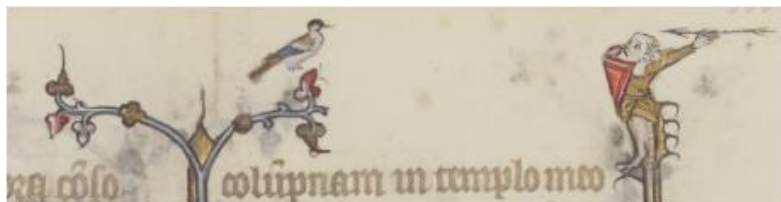
Grotesques du feuillet 338 recto

Ce bréviaire a été numérisé à 600 DPI, permettant d'apprécier les détails des enluminures et notamment des grotesques dans les marges (petits personnages ou animaux comme des singes ou des dragons) ainsi que des scénettes inscrites au bout des baguettes décoratives.